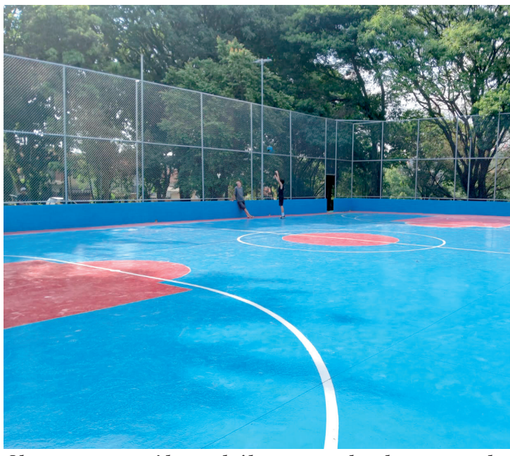
Obra era para ter sido concluída em novembro do ano passado

O atraso na entrega total do espaço levanta questionamentos sobre a real funcionalidade da revitalização. Mesmo com um investimento significativo de R$ 1.432.028,50, a falta