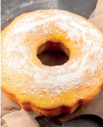
Uma fatia é sempre bom

Ingredientes: 2 xícaras (chá) de açúcar; 4 colheres (sopa) de margarina sem sal; 3 ovos; 1 xícara (chá) de leite; 3 xícaras (chá) de farinha de trigo; 1 colher (sopa) de fermento em pó; 2 colheres (sopa) de chocolate em pó. Preparo: Não use batedeira, bata com colher de pau. Misture o açúcar com a margarina até ficar bem homogêneo, adicione os ovos inteiros, um a um, batendo sempre a cada adição. Alternadamente, vá juntando a esta mistura, o leite e a farinha, aos poucos, batendo sempre. Por último, acrescente o fermento em pó. Separe um pouco da massa em uma tigela e acrescente o chocolate em pó. Unte uma forma (redonda de buraco no meio) com margarina e polvilhe com farinha de trigo, despeje metade da massa branca, por cima coloque a massa com chocolate e finalize com massa branca.