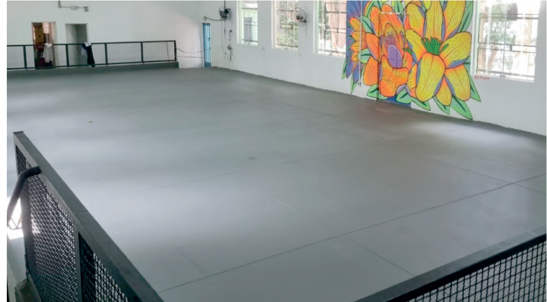
Inauguração será neste sábado (18) com diversas aulas para a comunidade

A partir do dia 18 de janeiro, o CDC (Clube da Comunidade) Castúlio do Amaral, localizado na Rua Pierre Curie, 286, no Jardim da Saúde, inaugura um novo salão de dança, oferecendo aulas variadas para a comunidade. O espaço de 200m² contará com modalidades como jazz, k-pop, fitdance, street jazz e clássicos dos anos 70, 80 e 90. Em parceria com o Studio B Dance Academy, o clube também disponibiliza vestiários, armários para guarda-volumes e um lounge de convivência. O evento de inauguração, das 9h às 12h, contará com aulas e apresentações especiais, incluindo dança do ventre e k-pop. Com o objetivo de promover bem-estar e felici-