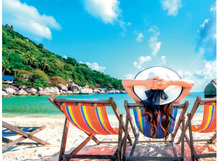
Leve sempre uma sacola para recolher seu lixo na praia

Segundo estudos, mais de 50% das espécies de mamíferos marinhos e aves marinhas já foram impactadas pela ingestão ou