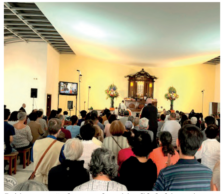
Pré-inauguração do centro de espiritualidade foi emocionante

No Budismo, não há nenhum deus, nenhuma liturgia, nenhum livro sagrado. Por isso, o Budismo original é um estilo de vida não-sectário, que pode ser seguido por