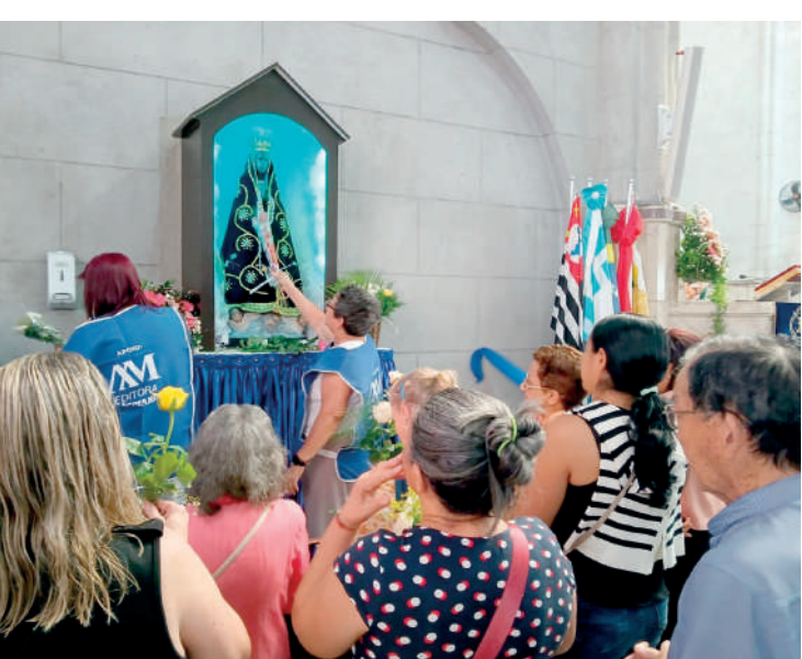
Santuário recebeu pessoas de diversas regiões da cidade

Assim como em todos os anos, o Santuário contou ainda com as tradicionais barracas de comensais e bebês, além de uma Procissão para Nossa Senhora Aparecida, realizada às 17h.