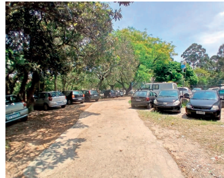
Veículos estacionados no local atrapalham começo das obras

Conforme apurou a reportagem, a Subprefeitura do Ipiranga, responsável pela fiscalização do que será feito, está trabalhando para poder adesivar os veículos que ali se encontram há mais de 5 dias, prazo permitido por Lei para permanência de carros estacionados em um mesmo local.