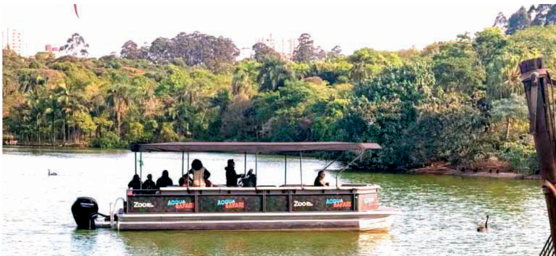
Atração é uma embarcação ecológica silenciosa que navega em uma velocidade de 5 km/h

O Zoológico de São Paulo está com uma nova atração: o Acqua Safari. Um passeio de barco que oferece uma experiência única no Lago São Francisco, que faz parte do Zoo SP. Durante o trajeto, os visitantes podem admirar a bela paisagem, a Ilha dos Primatas com 5 espécies de macacos, como o macaco-aranha-de-cara-branca, endêmico do Brasil, e ainda observar mais de 14 espécies de aves, entre as quais migratórias.