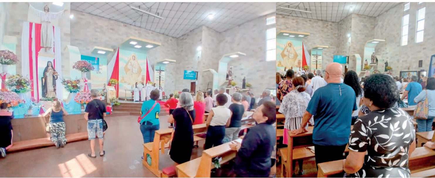
Missas foram celebradas durante o dia inteiro, com grande presença de fiéis e devotos da Santa de várias regiões da cidade

O alto índice de emprego na cidade de São Paulo impactou na festa de Santa Edwiges, Padroeira dos pobres e endividados, cujo dia é celebrado pela fé católica em 16 de outubro. Em outros anos, a falta de oportunidades de trabalho, fez com que mais fiéis e devotos levassem à santa suas carteiras para que fossem abençoados.