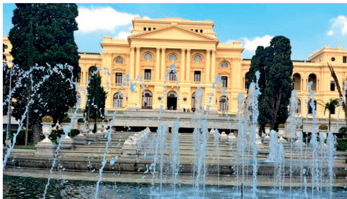
Programação especial de 7 de Setembro promete atividades para os mais variados públicos

Também no sábado será realizado o XIX Troféu Independência do Brasil, corrida e caminhada pelas ruas do bairro do Ipiranga. A prova retorna ao calendário após cinco anos e a expectativa de reunir 5 mil atletas. A largada será a partir das 6h30, em frente ao Museu. Diversas ruas serão interditadas no período da manhã.