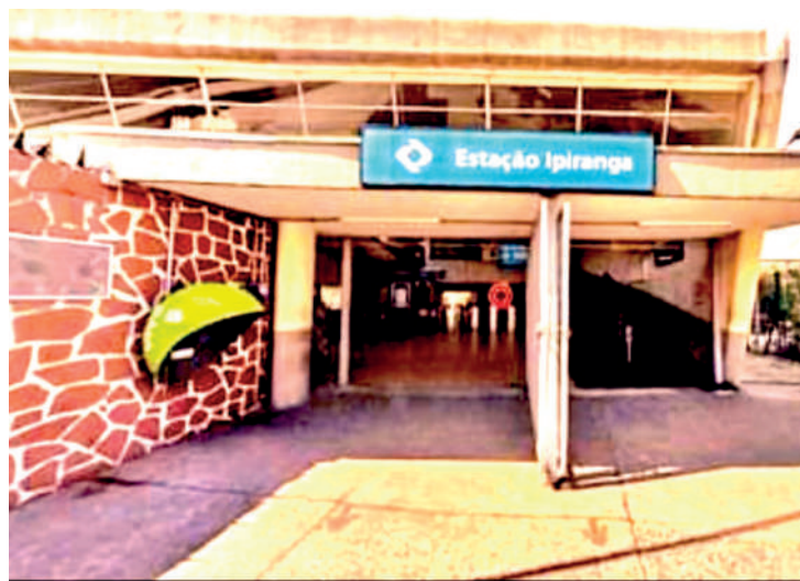
Estação deverá ser uma das mais modernas da CPTM

O início da obra foi marcado pelos trabalhos de perfuração de solo no canteiro, para a construção dos pilares do corpo da estação. A atividade foi feita por meio de "estacas-prancha", que são elementos estruturais que compõem a fundação profunda, sendo posicionadas no solo por maquinários especializados. Isso possibilita a execução das estacas que sustentam a estrutura da estação e das vigas que formam a via elevada por onde circulam os trens. Com meta de conclusão em 2027, a estação Ipiranga terá dois acessos, sendo o principal na avenida Presidente Wilson, 3.437 e o secundário pela estação da Linha 10-Turquesa. Ao todo,