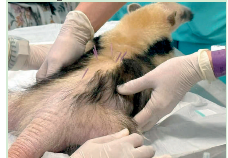
Outras espécies também passaram pelo tratamento alternativo

Um Tamanduá-mirim de oito meses passou por sua terceira sessão de acupuntura. O procedimento durou cerca de 10 minutos e foi necessário para auxiliar no tratamento do animal. Após constatarem que a mãe não estava produzindo leite, o que impactou no ganho de peso do filhote, médicos-veterinários realizaram uma intervenção implantando uma sonda gástrica para possibilitar a oferta direta de