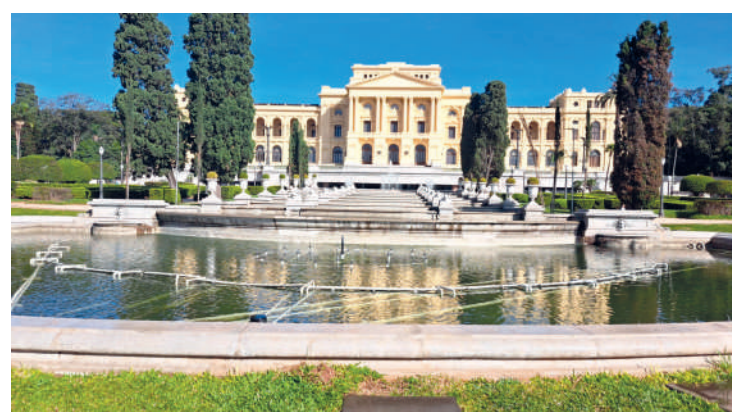
Bate-papo acontecerá no Auditório do Museu a partir das 14h

Em uma conversa direta com o público, os curadores da exposição temporária "Sentar, guardar, dormir: Museu da Casa Brasileira e Museu Paulista em diálogo" apresentarão como bancos, cadeiras, sofás, caixas, cômodas, escrivaninhas, guarda-roupas, redes e esteiras foram usados no Brasil ao longo do tempo como soluções para sentar, guardar e dormir. São 159 móveis expostos no Museu do Ipiranga, produzidos entre os séculos 16 e 21.