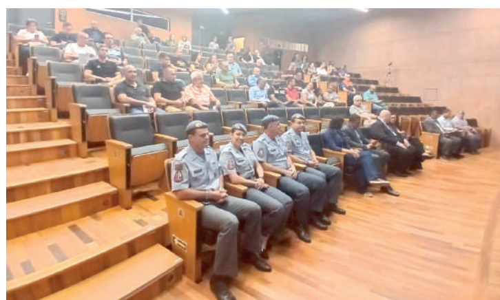
Reunião abordou como otimizar os trabalhos entre PM e vizinhança

“A nossa Constituição Federal é muito sábia e tem uma recomendação. Lá no Artigo 144, quando fala da segurança pública. Tem uma parte que a gente grava bem, que é a primeira, que fala assim: a segurança pública é um direito. A