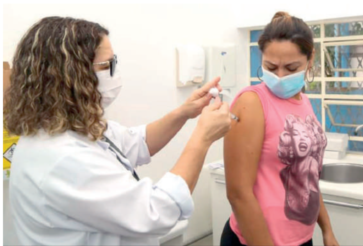
315 casos foram confirmados no estado de janeiro a julho

O estado de São Paulo, de janeiro a julho deste ano, confirmou 315 casos da doença. O número é bastante inferior aos 4.129 casos confirmados em 2022, quando a doença atingiu o pico no estado. Em 2023, no mesmo período, foram confirmados 88 casos.