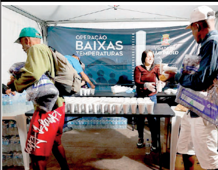
As tendas funcionam das 18 h às 0h e oferecem alimentos

Com a previsão de frio intenso nos próximos dias, a Prefeitura de São Paulo retomou a Operação Baixas Temperaturas (OBT), acionada sempre que os termômetros ou sensação térmica atingem 13°C ou menos.