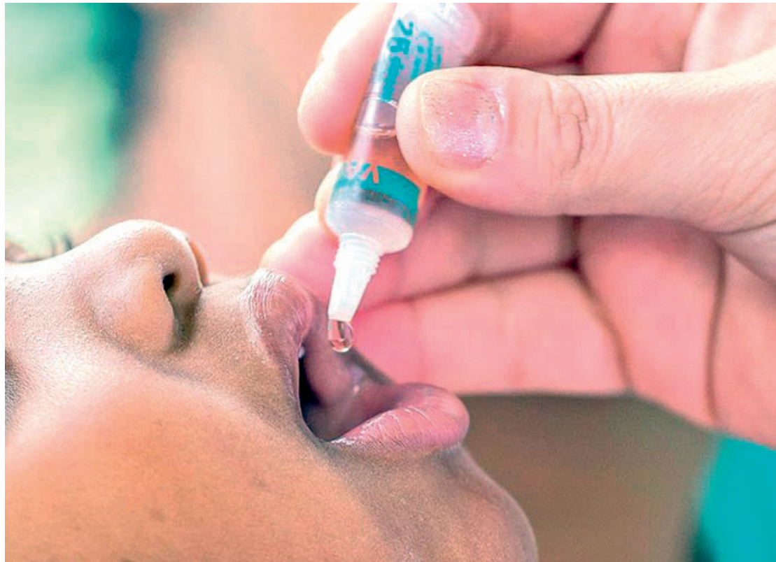
A Prefeitura de São Paulo iniciou na segunda-feira (27), a campanha de vacinação contra a poliomielite para crianças menores de 5 anos de idade. PÁGINA 3