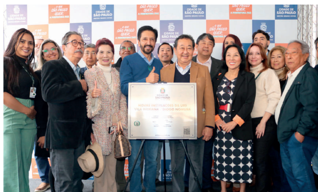
Novo endereço tem 1.305 m2 e a capacidade de realizar 4.544 atendimentos por mês

Segundo a Prefeitura, foram investidos R$ 6 milhões para a implantação do equipamento.