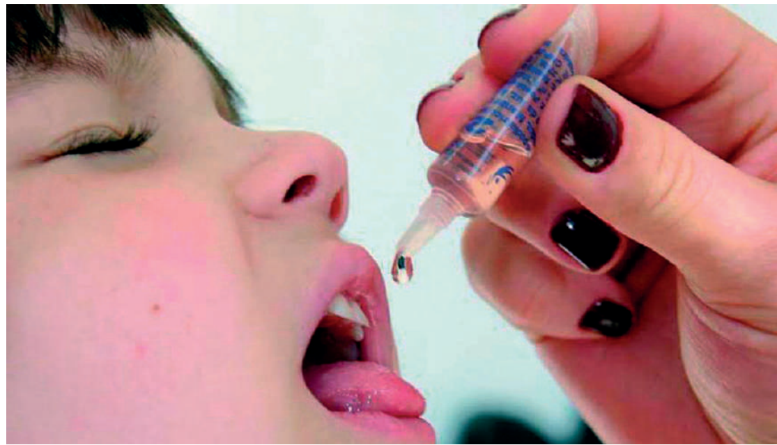
As vacinas estão disponíveis em todas as Unidades Básicas de Saúde (UBS) das 7h às 19h

A Prefeitura de São Paulo iniciou na segunda-feira (27), a campanha de vacinação contra a poliomielite para crianças menores de 5 anos de idade. Serão utilizadas as vacinas inativada poliomielite (VIP), para menores de 1 ano, e a oral poliomielite (VOP), conhecida como gotinha, para crianças entre 1 a menores de 5 anos, seguindo as diretrizes do Programa Nacional de Imunizações (PNI).