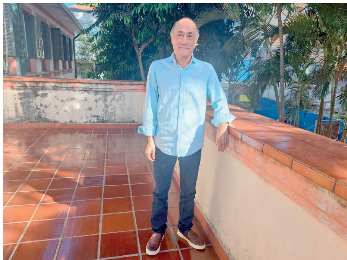
Novo comandante do bairro fala sobre lixos irregulares, segurança e o seu trabalho pelo bairro

“Eu estou chegando agora, não tenho as informações todas, mas estou me inteirando de tudo o que vai ser feito, mas a gente anda pelo Ipiranga e os grandes corredores já estão recapeados”, expressou ainda.