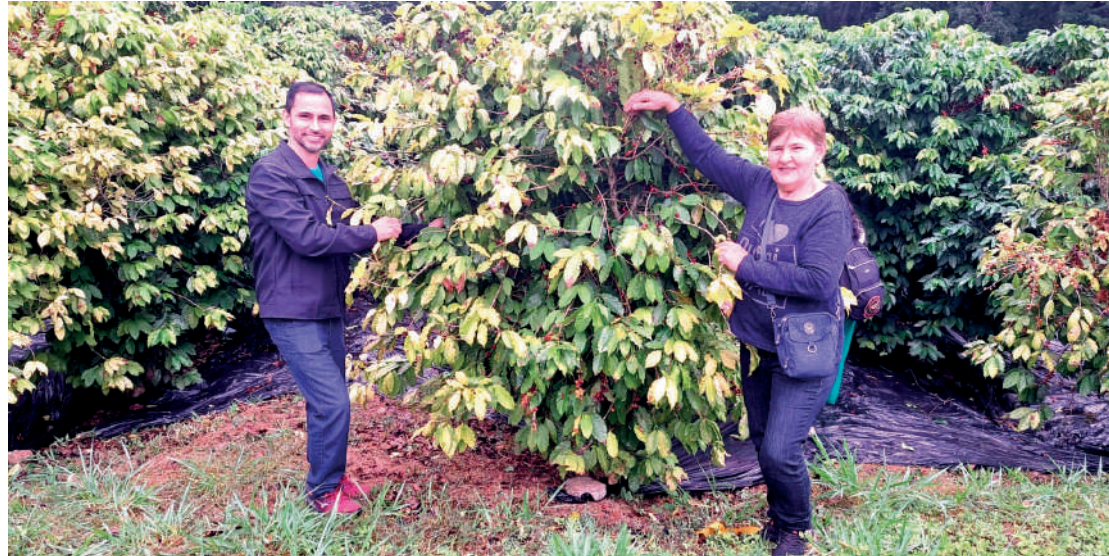
Mesmo com a queda de temperatura e mudança no tempo neste sábado (25), a 17ª edição da Colheita do Café, realizada pelo Instituto Biológico, foi um sucesso e reuniu dezenas de visitantes. PÁGINA 4