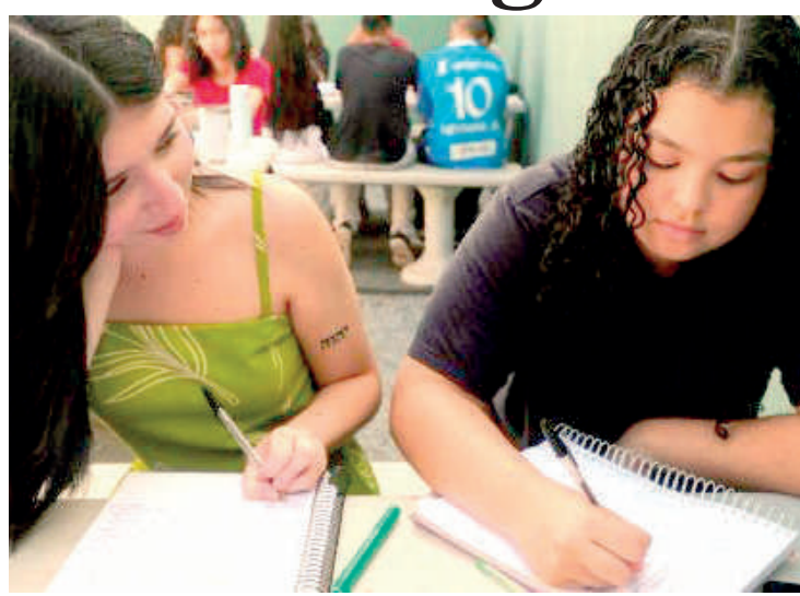
Cursos de inglês e mandarim serão apenas para alunos do EM

As aulas de Libras são abertas também a estudantes a partir do 7º ano do Ensino Fundamental, mas têm três semestres de duração. As aulas de português como língua estrangeira para estrangeiros estão disponíveis para estudantes a partir do 6º ano do Ensino Fundamental e são ministradas por um ano e meio.