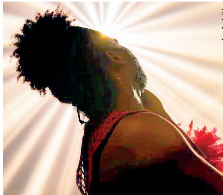
O espetáculo fica em cartaz a partir do dia 25/5 até 23/6

O Sesc Ipiranga fica na rua Bom Pastor, 822.