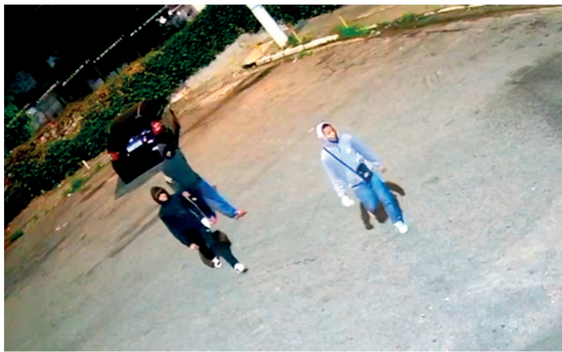
Imagens de câmeras de segurança obtidas pela reportagem mostram trajeto dos bandidos

A reportagem conseguiu, com exclusividade, uma sequência de imagens de câmeras de segurança que mostram o trajeto dos