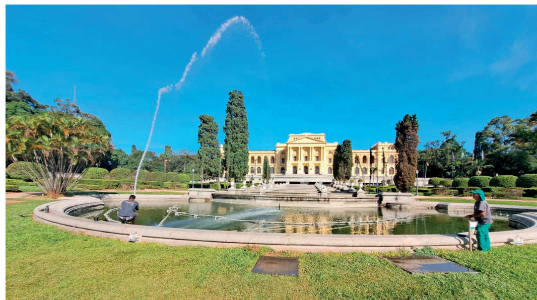
Visitas acontecerão todo dia 18 de maio, em homenagem ao Dia Internacional dos Museus

Às 10h30 (com tradução simultânea em Libras) e às 14h, quem comparecer às mostas de longa duração do «Ciclo Curatorial» («Catalogar: Moedas e Medalhas»), «Conservar: Brinquedos», «Comunicar: Louças» e «Coletar: Imagens e Objetos», localizadas no piso B) e «Para Entender o Museu» (piso térreo) pode participar de visitas guiadas temáticas oferecidas pela equipe educacional do Museu. As atividades não têm custo adicional