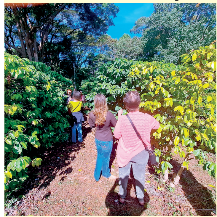
A 17ª edição da colheita do café acontece no sábado (25)

No sábado (25), o Instituto Biológico irá realizar a 17ª edição da Colheita do Café, abrindo as portas para que as pessoas possam participar da experiência de colher os grãos maduros do cafezal e saber como as pessoas que trabalham nas lavouras atuam.