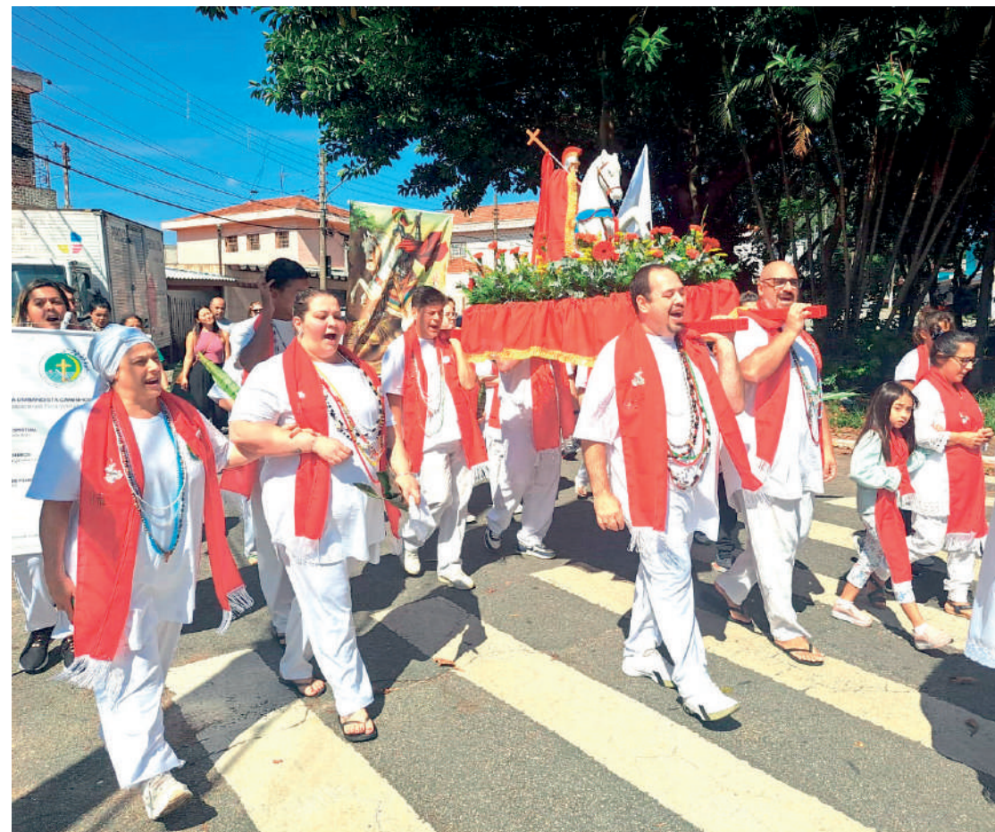
No sábado (20), uma procissão em homenagem ao Orixá da Religião Umbanda, Ogum, realizada pela Tenda Umbandista Caminhos de Aruanda (T.U.C.A), foi realizada em São João Clímaco e reuniu os filhos da casa além de fiéis da religião, percorrendo as principais ruas da região e cantando pontos. PÁGINA 2