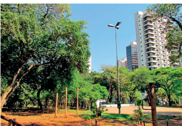
Praça Flávio Xavier de Toledo receberá as atrações o dia inteiro

O Portal do bairro na mesma rede também reagiu com palmas ao anúncio dos eventos que acontecerão no domingo. A festa contará com apoio da Subprefeitura do Ipiranga, Associação Comercial de São Paulo e importantes instituições da região, como Rotary Clube, por exemplo.