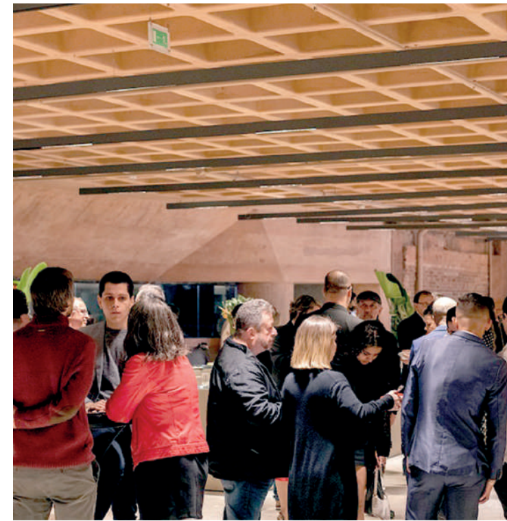
Porta de entrada do bairro e um dos lugares preferidos dos moradores da região, o Museu de Ipiranga atingiu a marca de 1 milhão de visitantes desde sua reinauguração, que aconteceu no dia 7 de setembro de 2022, após reformas as quais fizeram com que o local ficasse fechado. PÁGINA 3