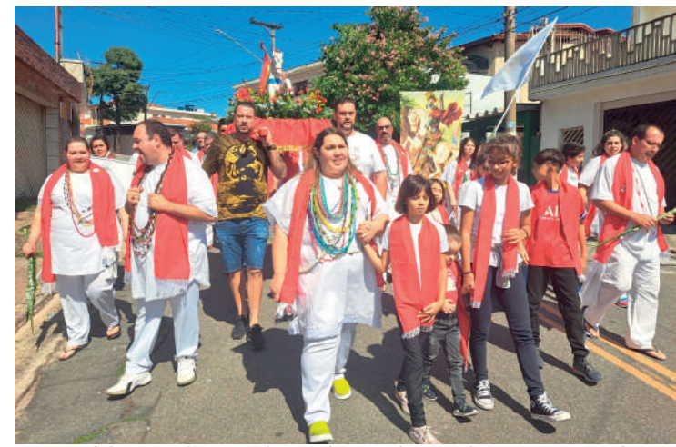
Esta foi a terceira procissão do terreiro em homenagem a Ogum

A Tenda Umbandista Caminhos de Aruanda fica na Rua Cavalheiro Frontini, 356, São João Clímaco, e as giras acontecem às sextas-feiras, 20h.