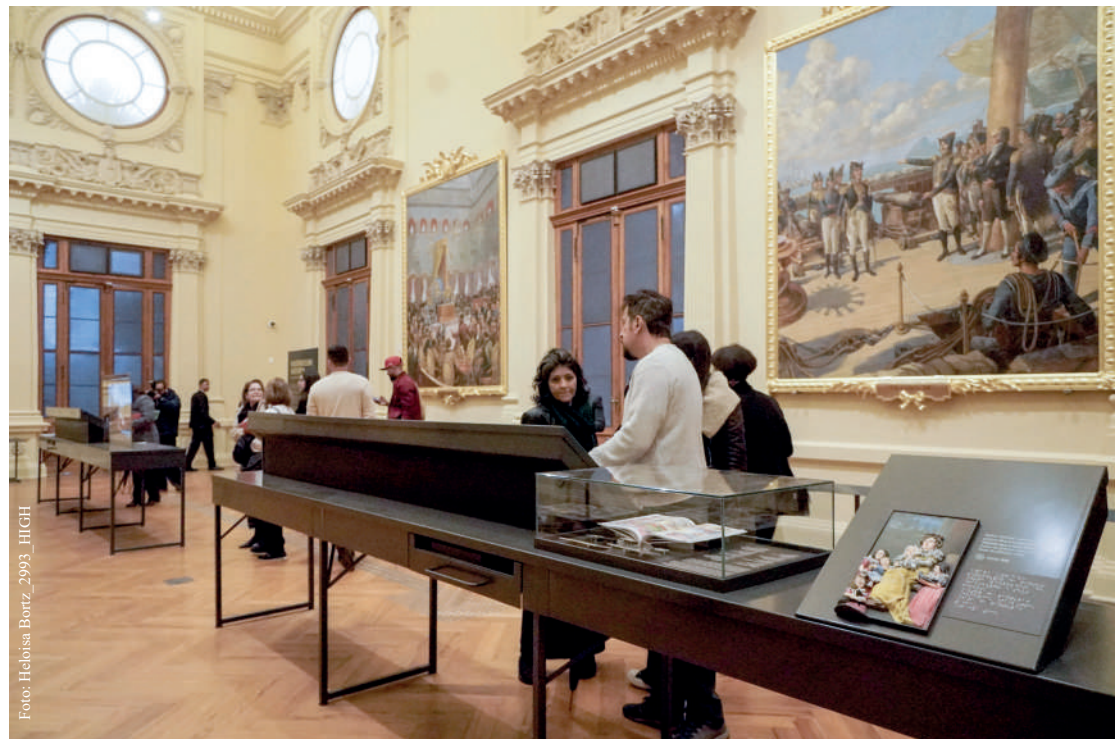
Desde setembro de 2022, diferentes tipos de pessoas estiveram no Monumento Histórico