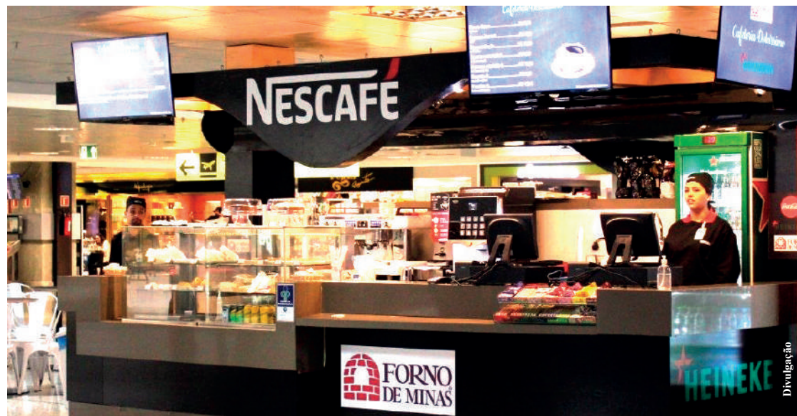
Cafeteria vencedora da licitação tem lojas nos aeroportos de Congonhas e Santos Dumont

Desde que passou por ampla reforma, o Museu do Ipiranga vem ampliando o número de visitantes. De acordo com informações da administração, no ano passado o Museu do Ipiranga recebeu quase 700 mil visitantes.