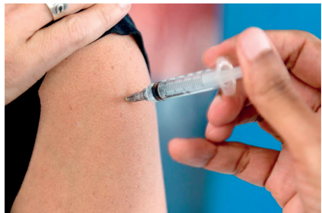
A partir do dia 1 de abril, a campanha passa a contemplar pessoas com maior exposição à doença

A partir de 1º de abril, a campanha passa a contemplar também as pessoas com maior exposição para a doença conforme lista do Programa Nacional de Imunizações (PNI): trabalhadores da saúde; professores do ensino básico a superior; profissionais das forças de segurança e salvamento; profissionais das Forças Armadas; caminhoneiros; trabalhadores de transporte coletivo rodoviário para passageiros urbano e de longo curso; trabalhadores