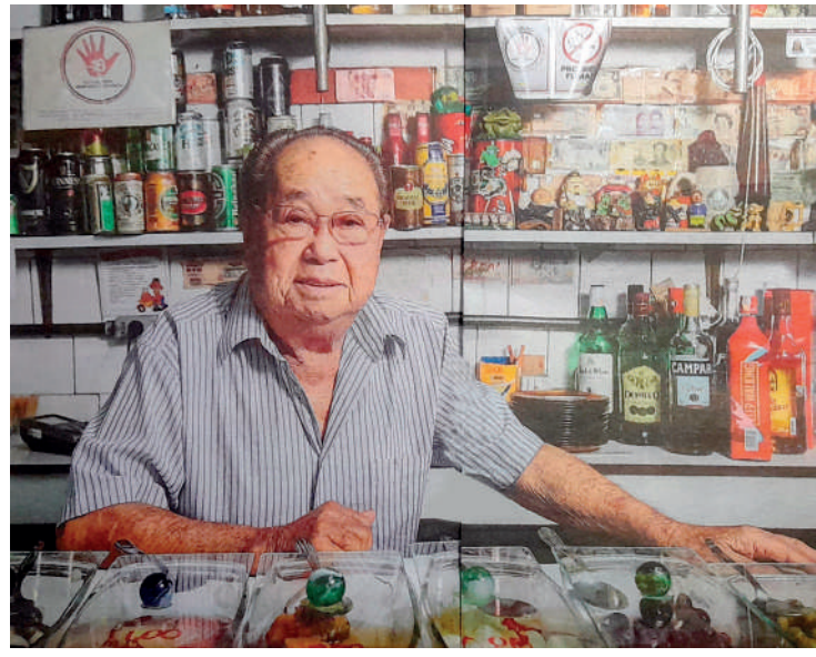
Sintomas gripais debilitaram o comerciante e o levaram à morte