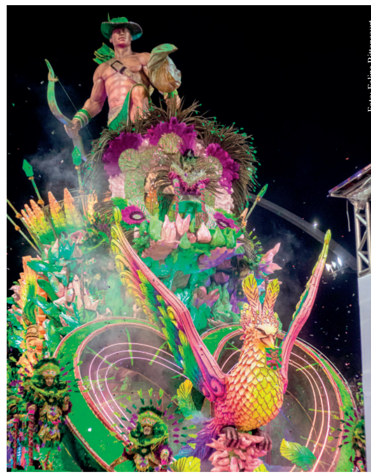
Escola fez bonito na avenida e ficou com “gostinho de quero mais”

Agora, a Barroca Zona Sul começará a se preparar para o Carnaval de 2025.