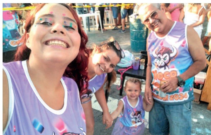
Bloco do Boi desfilou pela rua Izonoro animando os foliões