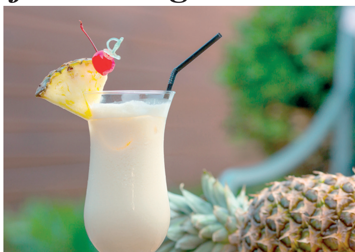
Versão do drink caribenho Piña Colada faz muito sucesso

Ingredientes: 75 ml de cachaça envelhecida; 100 ml de suco de abacaxi (pode usar também o purê da fruta ou a polpa congelada); 20 ml de melado de cana; 10 ml de suco de limão; 60 ml de leite de coco; 5 pedras de gelo. Preparo: Coloque todos os ingredientes na coqueteleira e bata vigorosamente. Despeje o drinque em um copo longo e sirva sem o gelo. Decore com um triângulo de abacaxi ou folhas da coroa na lateral do copo para caracterizar esta releitura da Piña Colada, um conhecido drinque com ares caribenhos.