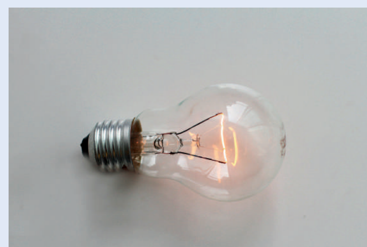
Desligue os aparelhos eletrônicos da tomada para evitar curto