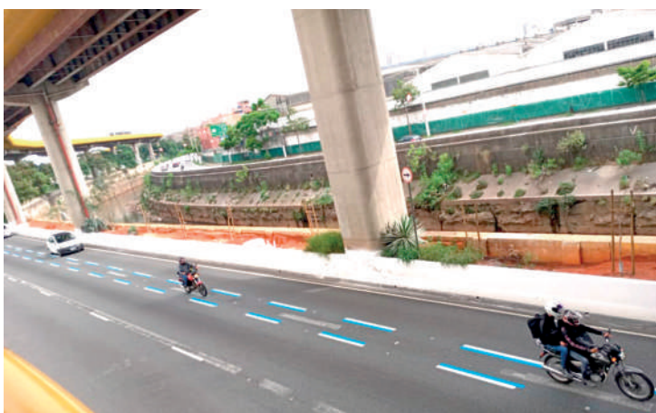
Diversas placas sinalizando a “Faixa Azul” foram instaladas

nas das Bandeirantes e 23 de Maio já estão com a Faixa Azul em funcionamento e, segundo dados da Prefeitura, os riscos diminuíram de fato desde de que ela foi implantada nestes locais.