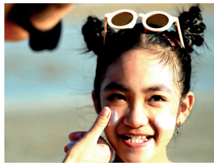
Além de protetor solar, use chapéus e roupas com proteção UV

Use protetor solar Utilize produtos específicos para o público infantil, com fator de proteção alto e