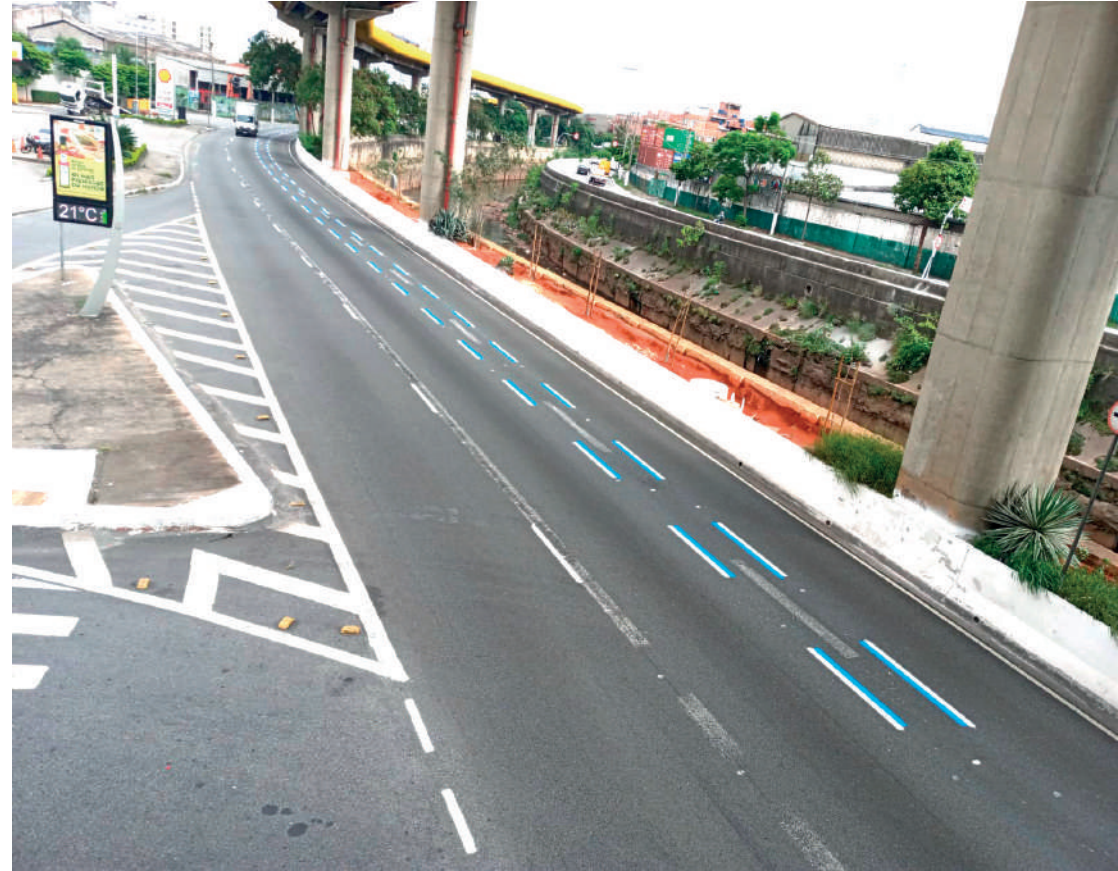
O ano termina com uma grande mudança para os motoristas que trafegam pela Avenida do Estado; em dezembro a CET instalou na via a "Faixa Azul", exclusiva para os motociclistas; trecho vai da rua do Patriotas até a rua da Mooca. PÁGINA 4

sobre o consumo promulgada na quarta-feira (20) pelo Congresso Nacional, a expectativa é alta e pode provocar muitas mudanças na vida dos brasileiros na hora de comprar produtos e serviços. Infelizmente, o cenário econômico ainda é delicado, com elevado grau de endividamento das famílias, num contexto de juros elevados, que termina reduzindo a renda disponível para o consumo. NOSSA OPINIÃO PÁGINA 2