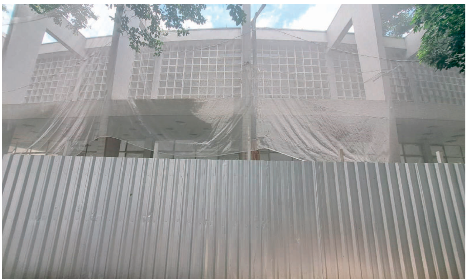
Teatro completou 71 anos dia 25 de dezembro; previsão é de que as obras terminem no começo de 2024 com melhorias na acessibilidade

Inaugurado em 25 de dezembro de 1952, este ano o João Caetano completou 71 anos. O teatro presta homenagem a João Caetano (1808