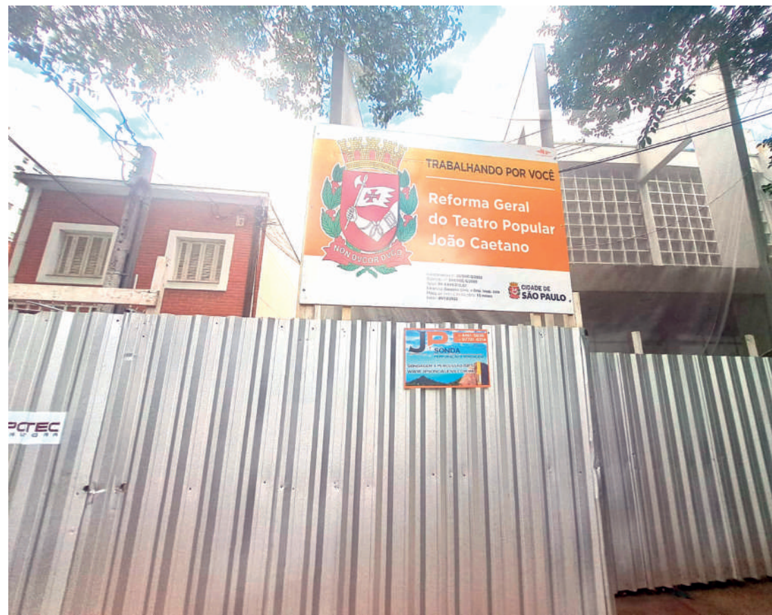
Local foi fechado em dezembro do ano passado e passa por uma reforma avaliada em quase R$ 7 milhões; resta saber se as obras serão entregues no prazo, pois quando a reportagem visitou o local não encontrou ninguém trabalhando. PÁGINA 3