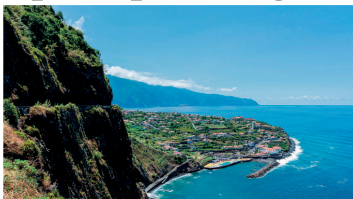
Clima na Capital costuma ser de 17°C mesmo no inverno

A apenas 1h30 de voo da capital Lisboa, o Aeroporto Internacional Cristiano Ronaldo,