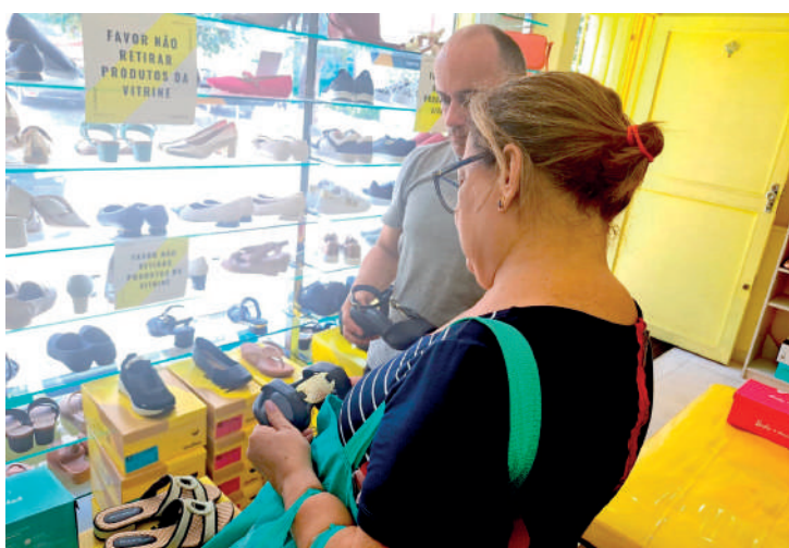
Loja de calçados na Agostinho Gomes está otimista com as vendas

“Estamos otimistas. Os resultados, até agora, estão satisfatórios e a gente está confiante de que vai ser um Natal dentro do que a gente espera e para o Ano Novo também”, destacou ele, frisando que o período