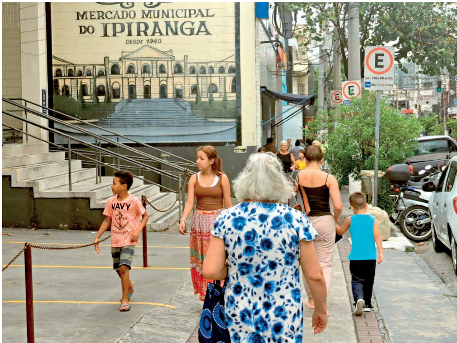
Com a proximidade das festas de final de ano, os comerciantes da região do Ipiranga estão animados e na expectativa de atrair um maior número de clientes para seus estabelecimentos. PÁGINA 4

Grande parte do crescimento desta população em situação de rua ocorreu entre 2019 e 2022, com o impacto da pandemia de covid-19 nesse segmento populacional. É triste saber que, para grande parte da sociedade, essas pessoas são "invisíveis". Somente em 2010 é que essa população foi incluída no Cadastro Único e, em 2011, passou a ter direito de acesso aos serviços do Sistema Único de Saúde (SUS) mesmo sem comprovante de residência. NOSSA OPINIÃO PÁGINA 2