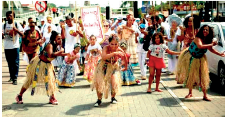
Apresentação musical é gratuita e acontece nesta sexta-feira (15)

Acontecerá no Sesc Vila Mariana, na sexta-feira (15), das 18h30 às 19h30, uma apresentação musical gratuita do "Acafro Afóxé Omo L'Oyá", que possui em sua história a união da cultura africana com a cultura popular brasileira, fazendo um trabalho de preservação, fortalecimento, permanência e continuidade ancestral. "Afoxé Omó' L'Oyá" nasceu dentro do Terreiro de Candomblé, Ilê Egbé Alaketú Oyá Alagbará, no ano de 2015, na cidade de Franco da Rocha, em São Paulo. Omó L'Oyá, homenageia a orixá Oyá, a grande divindade guerreira, dona dos ventos, impetuosa, forte, audaciosa, corajosa, e que possui um olhar mais justo e igualitário para toda a sociedade. O Sesc Vila Mariana fica na rua Pelotas, 141.