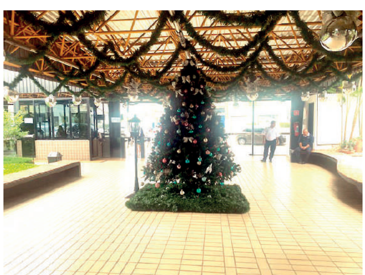
Clima de Natal chega ao Clube; o presépio tem um significado muito importante para os católicos e foi criado há 800 anos, em 1223

O clima de natal chegou ao Clube Atlético Ypiranga (CAY). Uma enorme árvore de Natal e um presépio foram montados na entrada principal do clube, trazendo o simbolismo do natal aos 6,5 mil sócios do Vovô da Colina.