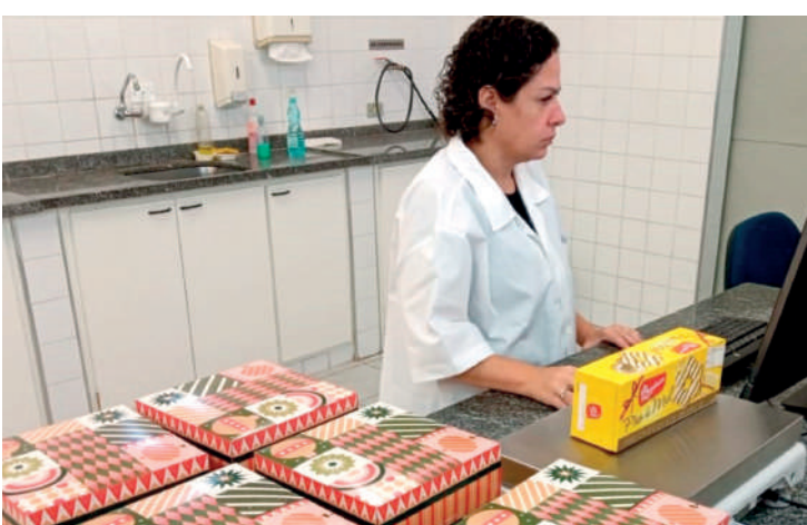
Operação “Pente Fino” avaliou 220 produtos como peru e pernil

No Estado, a operação “Pente Fino” avaliou 220 produtos (aves e carnes típicas das ceias de fim de ano, como peru, chester, codorna, tender, presunto, pernil, lombo, pescados e carnes em geral, além de cereais, pães, panetones, bolos, frutas in natura e secas), dos