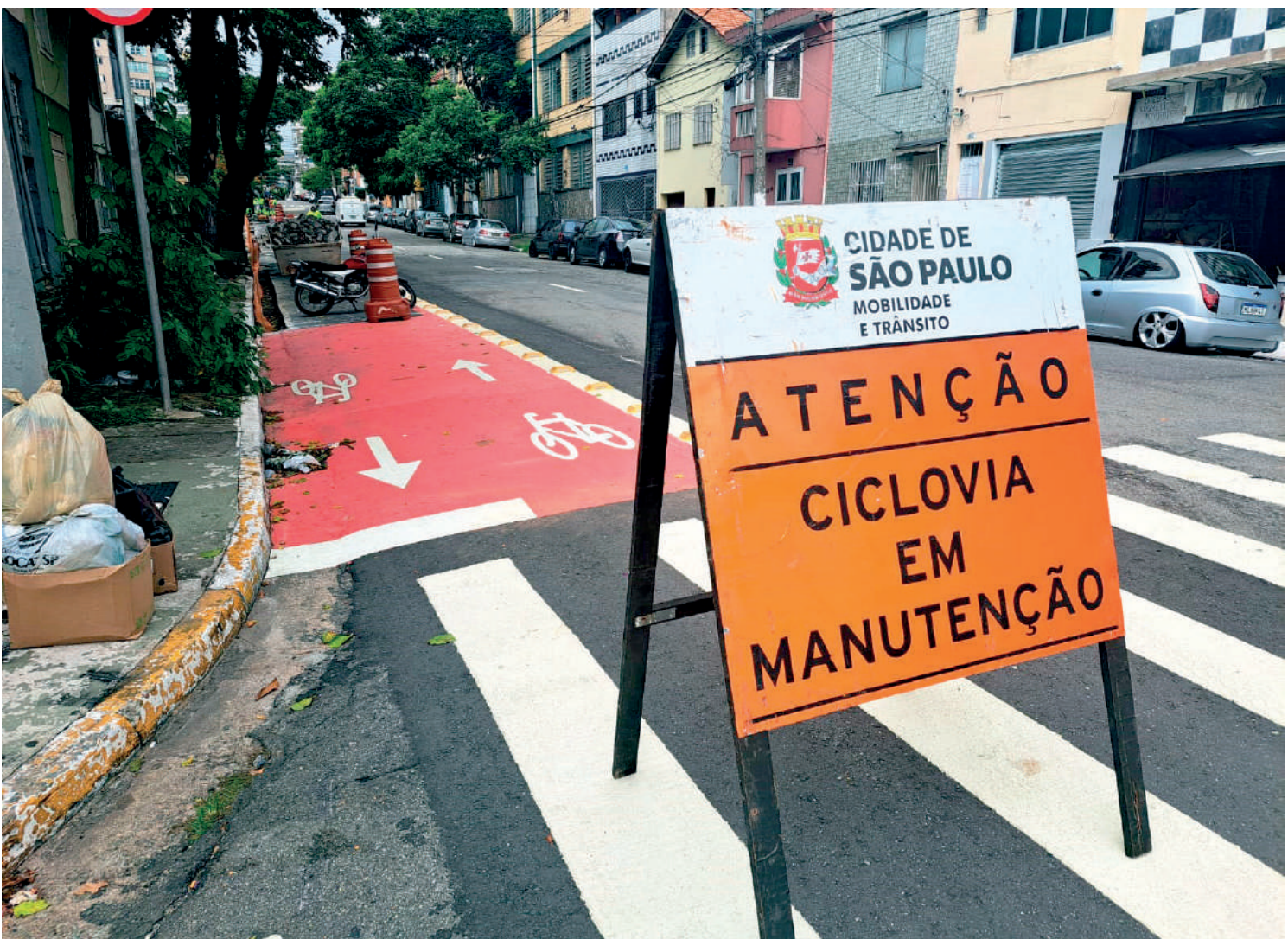
Desde a última semana, profissionais trabalham para que a ciclofaixa seja implantada na via, onde um bom trecho já foi pintado de vermelho em menção à faixa destinada aos ciclistas. PÁGINA 3