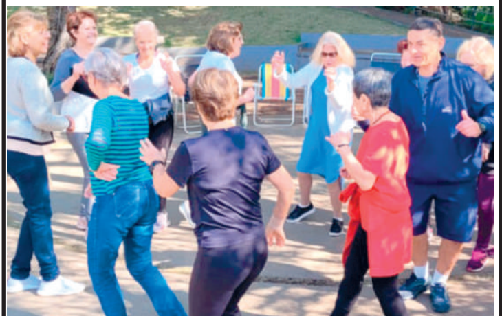
Ação gratuita "Corpo e Movimento" acontece neste sábado

Os frequentadores do Sesc Ipiranga que gostam de vivenciar práticas corporais poderão participar, neste sábado (16), das 14h às 15h, da ação gratuita "Corpo e Movimento", que acontecerá no quintal da unidade, levando danças, capoeira, expressões corporais e artes marciais para aqueles que desejam participar. As atividades envolvem movimentos que trabalham força, flexibilidade, ritmo, respiração, concentração, e que colaboram para o autoconhecimento. Já na sexta-feira (15), das 13h30 às 15h, acontecerá, na Sala 1 do Sesc Ipiranga, a oficina de artes visuais gra-