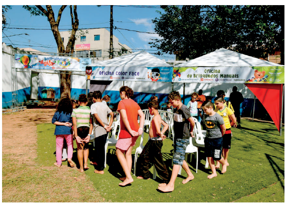
Podem participar crianças desde a primeira infância até adolescentes de 12 a 17 anos

Nos meses de férias, é importante manter a garotada em atividade, de preferência com muita diversão. Por isso, a Secretaria Municipal de Esportes e Lazer da Prefeitura de São Paulo, promove a partir do dia 22 de dezembro mais uma etapa do programa Agita + Férias, com opções de esporte e lazer para crianças e adolescentes se distraírem e se exercitarem. As atividades são oferecidas de sexta-feira a domingo, das 10h às 17h, em dez Centros Esportivos das Zonas Norte, Leste, Oeste, Sul e Central. São brinquedos infláveis, espaço gourmet kids, atividades recreativas de brincadeira de rua, espaço recreativo baby e oficinas diversas: pintura de rosto, brinquedos manuais, esporte e dança, entre outras atrações. Para os mais radicais e crescidinhos, vai ter pista de skate e pump track em alguns locais. O Agita + Férias segue o calendário oficial de férias escolares da rede municipal da Prefeitura de São Paulo e tem como foco a primeira infância,