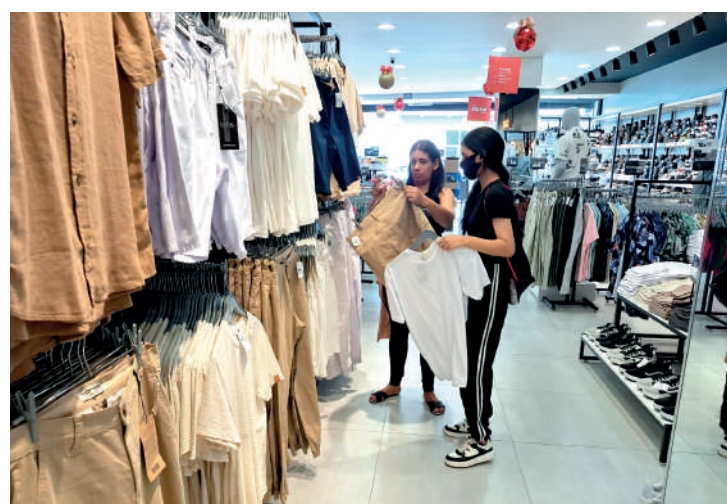
Há 15 anos na av. Santa Catarina, loja registra bom movimento