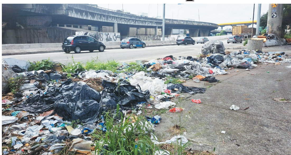
A proposta é inibir a prática que se agrava cada vez mais na capital prejudicando a população

como acumular resíduos sólidos domiciliares em locais não autorizados pelo Poder Público (passando de R$ 50,00 para R$ 2 mil), entre outras (a relação completa está abaixo). Para quem não realizar a devida limpeza, após o término de uma obra, a penalidade passa de R$ 50 para R$ 2 mil por dia, de acordo com o PL. O valor a ser pago, por aqueles que depositarem resíduos nos chamados “bota-fora”, encostas, corpos de água, lotes vagos, passeios, vias e outras áreas públicas e em áreas protegidas por Lei, passa dos atuais R$ 500,00 para R$ 25 mil por dia.