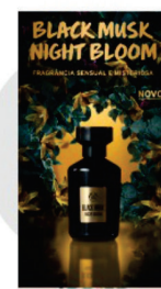
BELEZA E ESTÉTICA VERTICAL