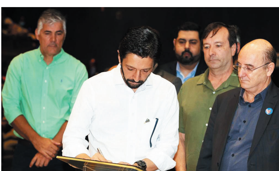
A área do terreno possui um total de 21.669,54 m² e foi transferida para a Cohab-SP

"Este é um momento especial para garantir que as pessoas deem mais um passo em direção à casa própria. Juntos conseguimos construir uma cidade e um Estado melhores, e o dia de hoje representa justamente isso,