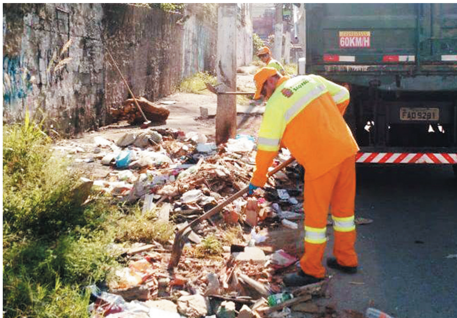
A Prefeitura de São Paulo vai multar em até 30 mil reais quem for flagrado fazendo descarte irregular de lixo em vias pluviais. O projeto de lei foi aprovado pela Câmara Municipal na última quarta-feira (22). PÁGINA 3