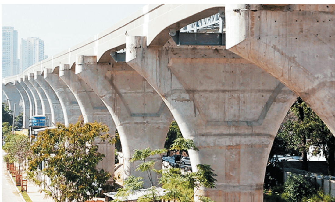
Metrô pretende pagar R$ 432 mi para que um dos participantes da licitação assumia o serviço

O consórcio Paulitec-Sacyr, que pediu R$ 513 milhões