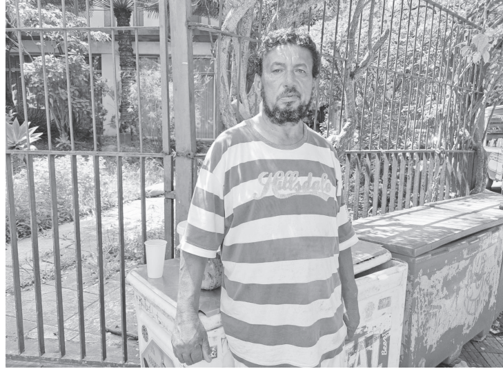
Se recuperando, comerciante ainda deverá deixar sua moradia no meu lugar de trabalho é ter ficado bem – o médico melhor ainda. Estou muito feliz e grato a Deus por acertou o remédio – e por poder voltar”, ressaltou,

“Eu não tenho muita força na mão direita, por exemplo, tive um segundo AVC, foi complicado, mas trabalhar com o público é muito bom e estar de volta