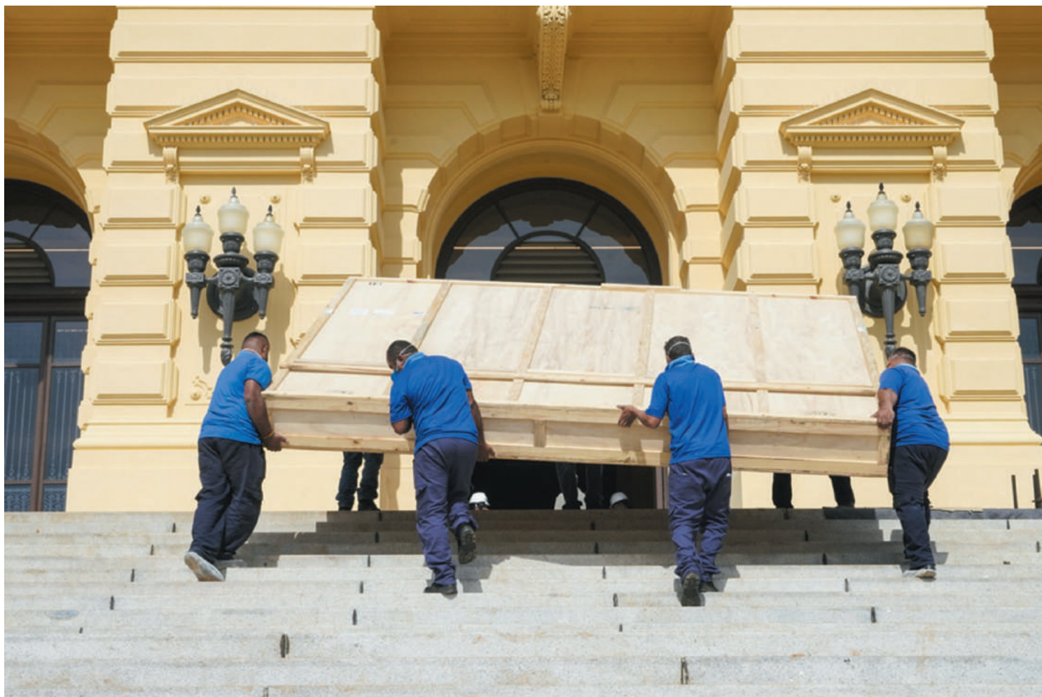
O retorno das obras de artes ao Museu esta sendo motivo de alegria para funcionários, professores e a população do Ipiranga

Considerado o mais importante museu do País, o Museu do Ipiranga, administrado pela Universidade de São Paulo (USP), possui mais de 450 mil itens de grande relevância histórica. Na sua reabertura, segundo informações da historiadora e coordenadora do programa de exposições do