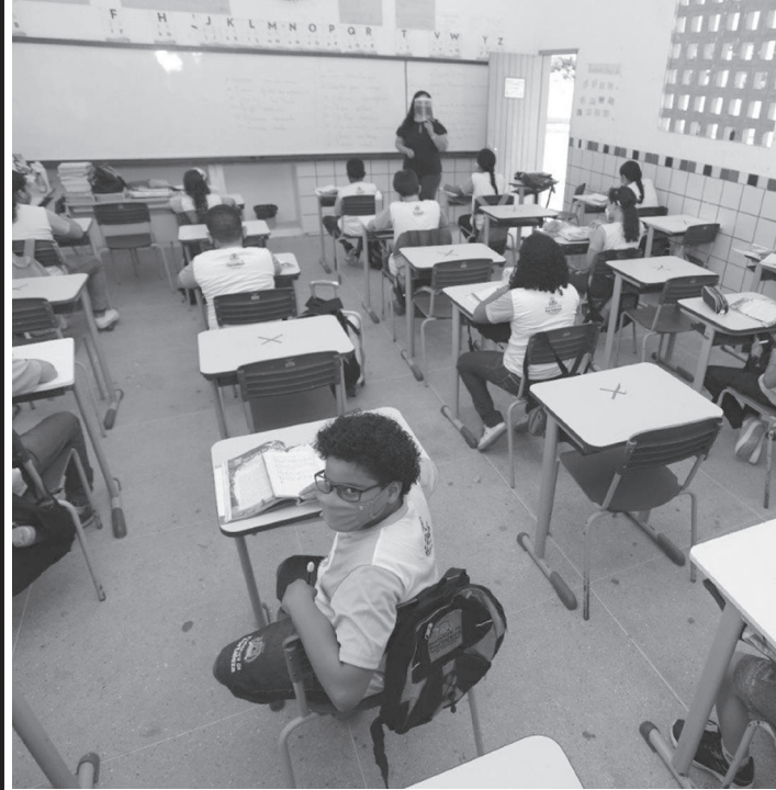
O novo salário só vale para quem fizer a opção pelo novo regime

Muito criticado pelos professores, pois tira direitos conquistados pela categoria ao longo dos anos, foi publicado nesta terça-feira (31) o decreto para adesão na Nova Carreira Docente, que estabelece o salário inicial em R$ 5 mil para professores da rede estadual. O sistema para escolha está no ar desde o dia (1) e a partir desta data os profissionais terão 24 meses para optarem ou não pelo novo modelo. Os que realizarem a escolha antes do fechamento da folha do mês já receberão o novo valor no pagamento de julho. Ainda, para auxiliar na decisão, a Secretaria da Educação do Estado de São Paulo (Seduc-SP) disponibilizou um simulador para que os docentes possam comparar a atual folha de pagamento com a da Nova