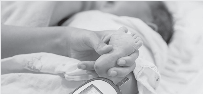
O teste do pezinho salva vidas e diagnostica várias doenças

Durante a campanha Junho Lilás, a Secretaria Municipal da Saúde (SMS) está enfatizando a importância da realização do teste do pezinho que, na rede municipal, é ampliado para a detecção de 50 doenças para os recém-nascidos.