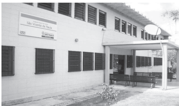
Na UBS tratamento para quem quer parar de fumar é grátis

Com o objetivo de reduzir a prevalência de fumantes e a consequente mortalidade relacionada ao consumo do tabaco, o Sistema Único de Saúde (SUS) oferece tratamento totalmente gratuito para quem deseja parar de fumar, o Programa Cessação de Tabagismo, promovido pelo Ministério da Saúde, pelo Instituto Nacional do Câncer (Inca) e coordenado pela Secretaria de Estado da Saúde (SES) de São Paulo. Na rede municipal de saúde, esse atendimento é feito regularmente pela Coordenadoria de Atenção Primária, que está preparada para realizar o acolhimento e o acompanhamento da cessação do tabagismo. Desde o seu lançamento, em 2016, o programa já atendeu 9.250 usuários na capital. “O tabagismo é a primeira causa de morte evitável no mundo. As ações educativas, legislativas e econômicas no Brasil vêm gerando um aumento no número de pessoas que querem parar de fumar, o que evidencia a importância de priorizar o tratamento