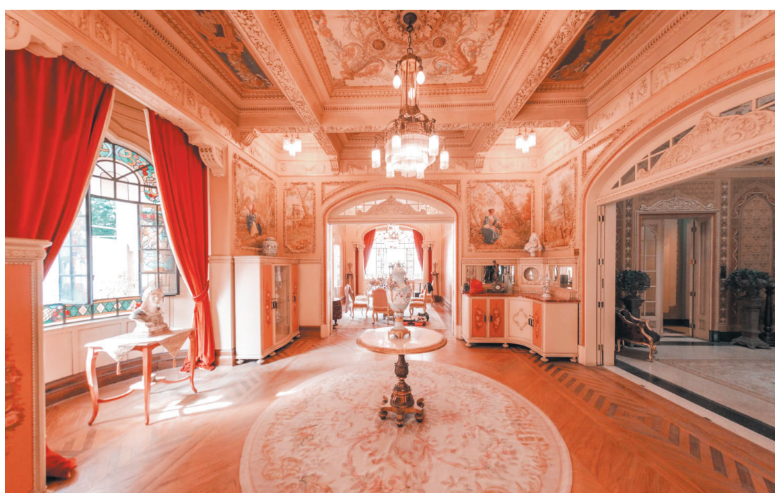
Espaço que serviu de residência para família Gasparetto vira local de festas de casamento e debutantes

Uma empresária, dona da empresa de eventos, e que prefere manter o anonimato, realizou a compra do imóvel de maneira inusitada, através de uma abordagem na rede social Instagram. “Realizamos festas em diversos espaços. Temos 14 no total, espalhados por toda São Paulo. Enquanto estava fazendo a gestão das redes sociais da empresa, apareceu uma de nossas clientes, moradora do Ipiranga que vai se casar em breve. Ela mandou o link do leilão. Repassei para a minha chefe, mas em tom de brincadeira. Porém, ela se interessou. Achou o valor bom, entrou em contato com o vendedor e fez a compra”, relata uma das funcionárias da empresa.