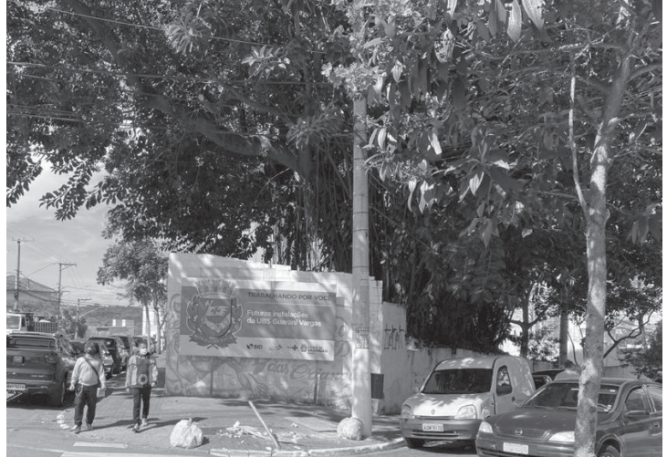
Terreno onde era clube de bocha vai abrigar unidade de saúde para atender população da região

Num terreno existente na Praça Francisco Sampaio Viana, no quadrilátero das avenidas Diederichsen, Leonardo da Vinci e rua Lucrécia Maciel, será construída a Unidade Básica de Saúde (UBS) Guarani/Vargas. O anúncio foi feito passada pelo prefeito Ricardo Nunes. A obra, segundo a Prefeitura, faz parte de um pacote de 35 unidades de saúde que serão executadas com recursos do Banco Interamericano de Desenvolvimento (BID). A iniciativa integra o programa Avanço Saúde SP, que tem como objetivo ampliar e aprimorar a infraestrutura da rede municipal de saúde da capital.