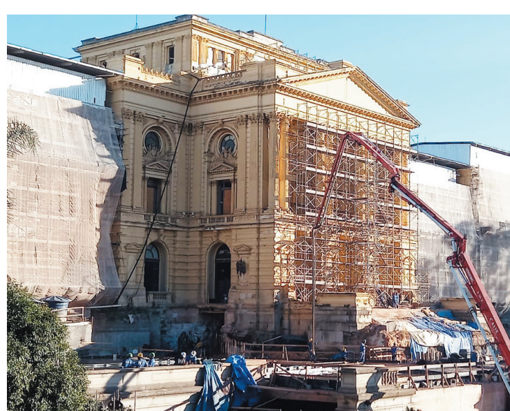
A reforma do museu ficará pronta até setembro de 2022

Após o fim das obras, terá início a montagem das 12 exposições que estarão em cartaz na reabertura, prevista para setembro. Diversas obras foram realizadas no museu. Na parte da ampliação, houve a concretagem da laje central da Esplanada, local onde ainda serão realizados mais dois trechos dessa mesma atividade. Já no Edifício Monumento, foi finalizada a restauração do teto do salão nobre, além da conclusão do restauro das paredes