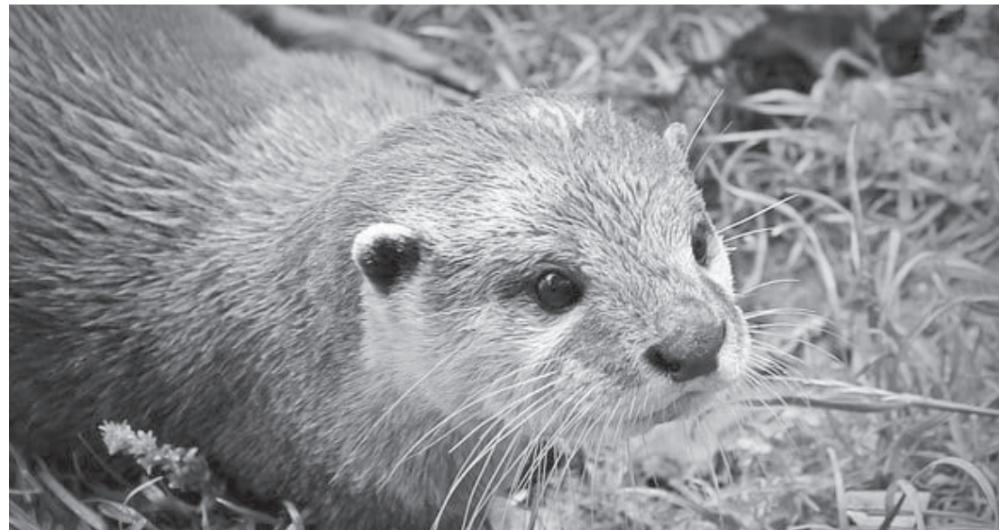
A Lontra é um animal ameaçado de extinção porque sua pele é usada para fazer casaco de alto luxo

gradativa, podendo se estender por meses. Para isso, o recinto de exposição foi adaptado e agora conta com uma divisória central como parte da cenografia. Esta estrutura metálica foi instalada tanto na parte seca do recinto quanto na área aquática para que os animais se acostumem um ao outro através de contato visual, estímulos odoríferos e vocalizações diversas entre assobios e grunhidos, sem contato físico nesta fase inicial de adaptação. A partir de então, as lontras serão acompanhadas pela equipe técnica para avaliação constante do comportamento até estarem aptas a viverem juntas, no entanto, já podem ser observadas pelo público no recinto localizado na Alameda Lago. As lontras são animais carnívoros e se alimentam de peixes e crustáceos, mas também podem consumir outros vertebrados e invertebrados. No Zoo de São Paulo, recebem diariamente alimentação balanceada composta por peixes, camarão e coração de