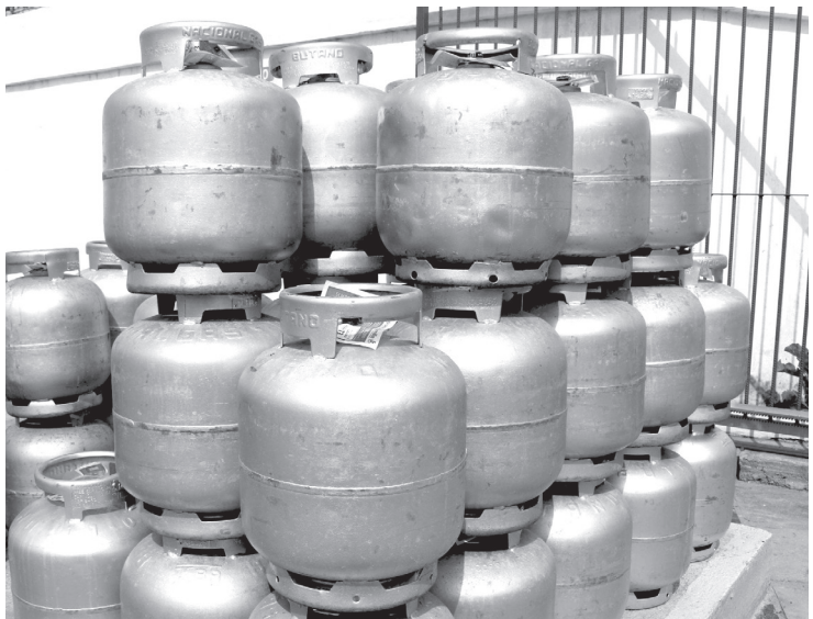
Na cidade de SP o botijão já superou o valor de R$ 100 reais

"Após inserir os dados no sistema, o portal imediatamente