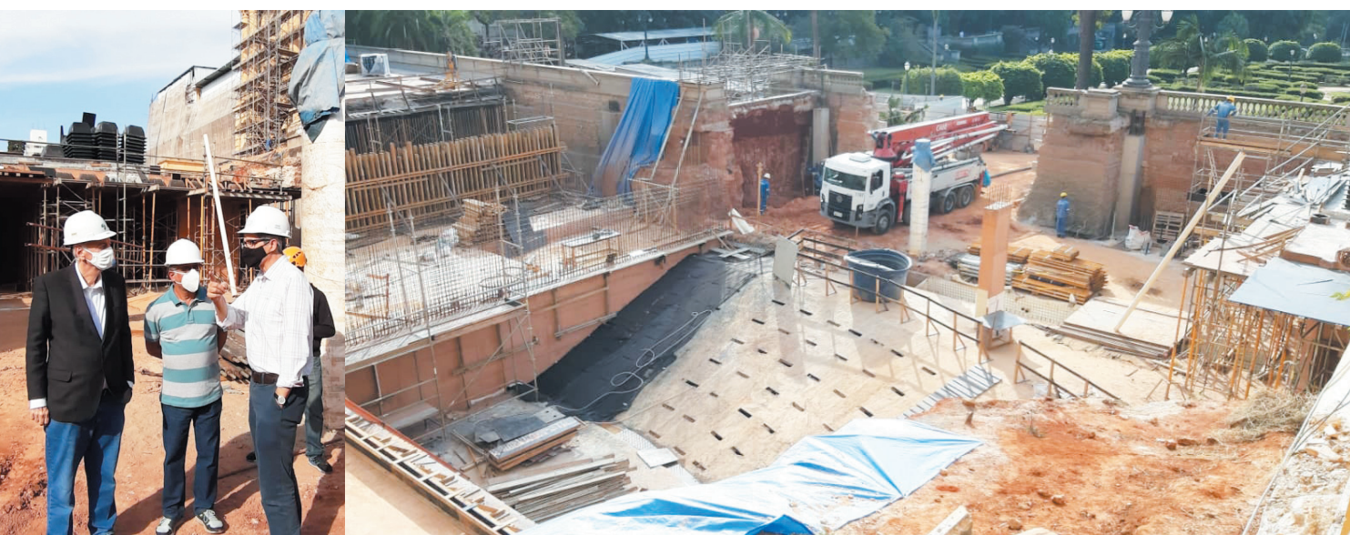
O conselheiro do TCM Domingos Dissei, visitou as obras do museu e anunciou que também haverá reformas no jardim

O Conselheiro do Tribunal de Contas do Município (TCM), Domingos Dissei, juntamente com a equipe técnica de seu Gabinete, realizou uma visita guiada nas obras de restauro e reforma do Museu do Ipiranga.