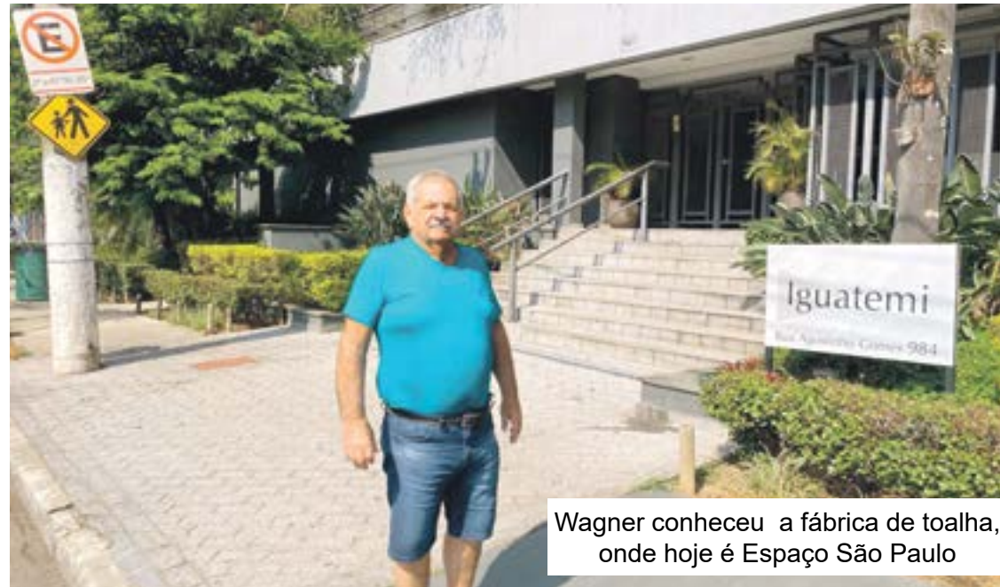
Wagner conheceu a fábrica de toalha, onde hoje é Espaço São Paulo

O Ipiranga no início do século XX era um bairro tipicamente operário, onde a família Jafet ergueu várias fábricas, aproveitando a proximidade com o porto