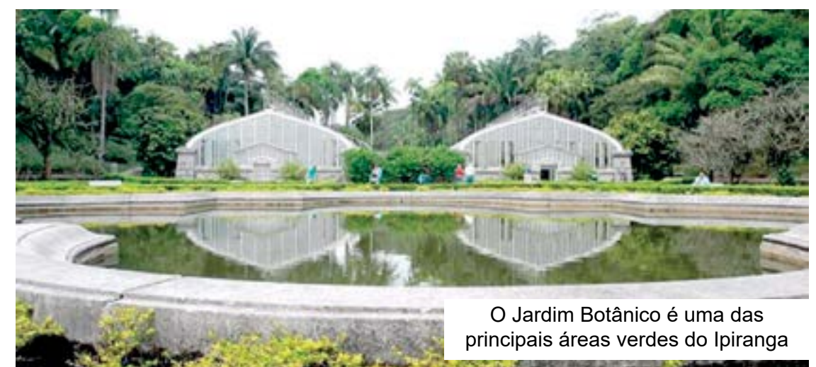
O Jardim Botânico é uma das principais áreas verdes do Ipiranga

Ainda dentro do parque há uma experiência sensorial por meio da textura das folhas, do cheiro das flores e da diversidade de sabores das plantas comestíveis que compõem o Jardim dos Sentidos. Na visita, o público passeia também pelo Jardim de Lineu, espaço projetado na década de 20 e inspirado nos jardins da Universidade de Upsala, na Suécia. O trecho é composto por um espelho d'água, escadarias centenárias, gramados e cercas vivas, além das estufas que são o cartão-postal do Botânico. É no Jardim Botânico onde nasce o riacho Ipiranga e