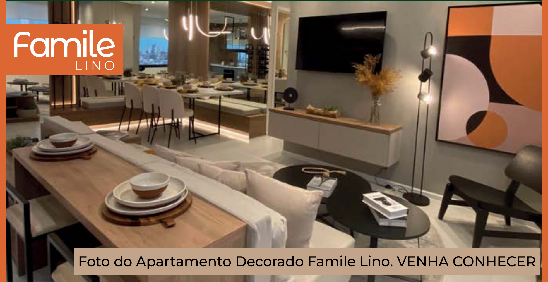
Foto do Apartamento Decorado Famile Lino. VENHA CONHECER

Há 41 anos acreditando e investindo no Ipiranga